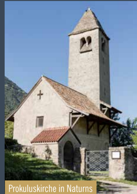
Prokuluskirche in Naturns